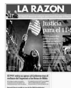
Ilustración 2. Portadas de los seis periódicos analizados