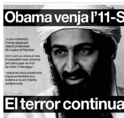
Ilustración 8. Fotografía de la portada de El Periódico

El Periódico , diario que se define como plural, progresista, laico, no dogmático y defensor activo de los derechos humanos, optó por ilustrar la noticia con una sola fotografía, la de un primer plano de Osama Bin Laden (Ilustración 8). A diferencia de la imagen utilizada por La Vanguardia , esta tiene un fondo neutro uniforme que centra la atención en la cara del líder de Al-Qaeda, la mirada del cual también da salida al recorrido visual de la mirada del espectador.