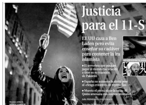
Ilustración 10. Fotografía de la portada de La Razón

Por último, La Razón , diario también de línea conservadora, abre la portada con una gran fotografía que muestra la alegría de una chica estadounidense a raíz del conocimiento de la noticia. Las portadas de La Razón suelen ser llamativas en muchas ocasiones, formadas por pocas noticias e ilustradas con una gran fotografía central, como en el caso que nos ocupa. En octubre de 2011, el día de la muerte de Gadafi, dedicó toda la fotografía de portada a hablar del cese de la actividad armada de ETA, sin ninguna referencia ni fotografía a la muerte del dictador libio.