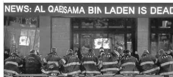
Ilustración 6. Fotografía superior de la portada de La Vanguardia

la noticia una imagen proveniente de The New York Times que muestra la reacción de los bomberos de Nueva York al conocer la noticia (Ilustración 6). El pie de fotografía es el siguiente: “Nueva York era una fiesta. Bomberos neoyorquinos expresan su júbilo en Times Square en el momento en que Obama anuncia la muerte de Bin Laden”.