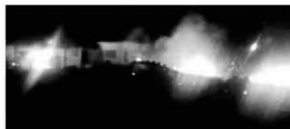
Ilustración 5. Fotografía inferior de la portada de El Mundo

La Vanguardia , considerado un periódico de centro político y monárquico, utilizó como fotografía principal para ilustrar