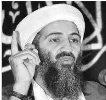
Ilustración 7. Fotografía inferior de la portada de La Vanguardia

La segunda imagen que utiliza la portada del periódico (Ilustración 7) es de menor tamaño y está situada en la parte inferior izquierda. No se trata de una imagen contemporánea, como las que hemos visto hasta ahora, sino de una de archivo. El retrato muestra un primer plano de la cara del terrorista, que mira hacia fuera de campo y de esta manera completa el recorrido visual del espectador de entrada y salida de la imagen.