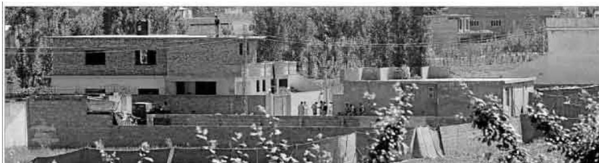
Ilustración 4. Fotografía superior de la portada de El Mundo

otros interrogantes por responder. A nivel de contigüidad, es la imagen más próxima a los hechos, pero esta es la única relevancia que tiene, ya que es una fotografía muy denotativa, no sugiere más de lo que muestra: la fachada exterior de una casa. Al no tener profundidad de campo, no hay más información en la imagen. Si no fuera por el texto del pie de fotografía, nada haría imaginar que dentro de este complejo residencial han podido suceder hechos tan trascendentes para el futuro de nuestra sociedad.