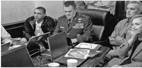
Ilustración 3. Fotografía de la portada de El País .

El País dedica una sola imagen (Ilustración 3) para ilustrar la noticia. Tomada por el fotógrafo oficial de la Casa Blanca, Pete Souza, tiene el siguiente pie de fotografía: “Cuarenta minutos de angustia. El presidente de EEUU siguió en directo desde la Casa Blanca, acompañado del gabinete de seguridad nacional, la operación militar, de 40 minutos de duración, que acabó con la vida de Osama Bin Laden. “Fueron los momentos más angustiosos de nuestras vidas”, afirmó ayer el principal asesor de seguridad, John Brennan. Junto a Barack Obama, el vicepresidente John Biden, a la izquierda, y la secretaria de Estado, Hillary Clinton, a la derecha.”